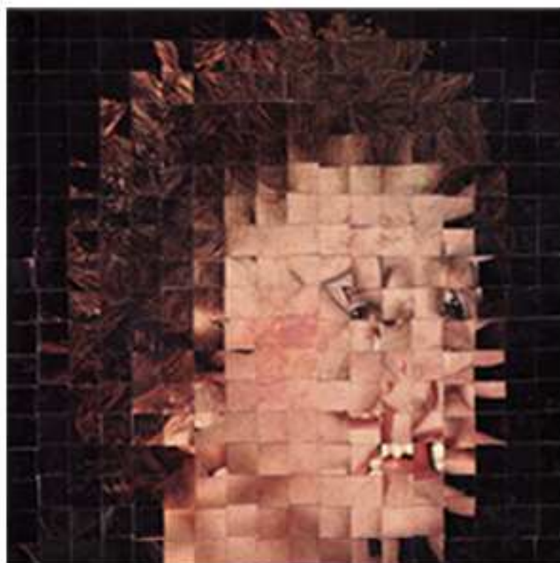
La vie en rose , 2010 Collage visuel et sonore