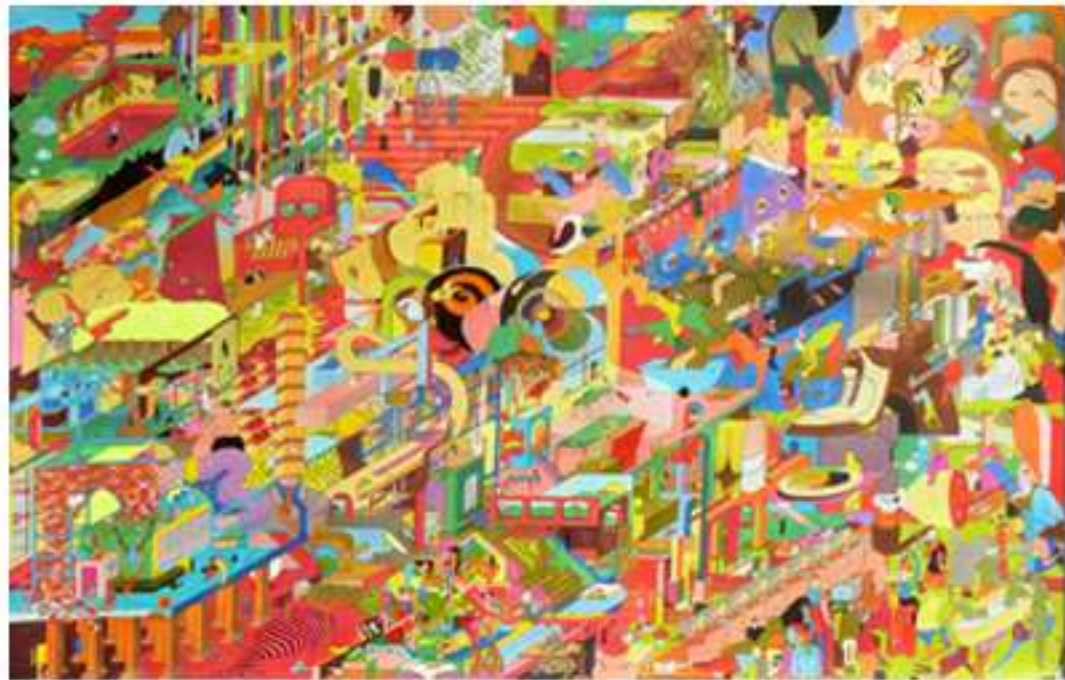
Le bouquet , 2008 (en collaboration avec Elia David) Techniques mixtes sur papier