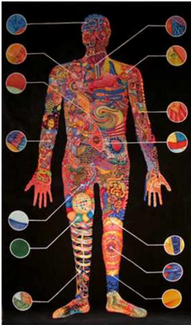
L'écorché , 2009 (en collaboration avec Elia David) Techniques mixtes sur papier 120 x 192 cm